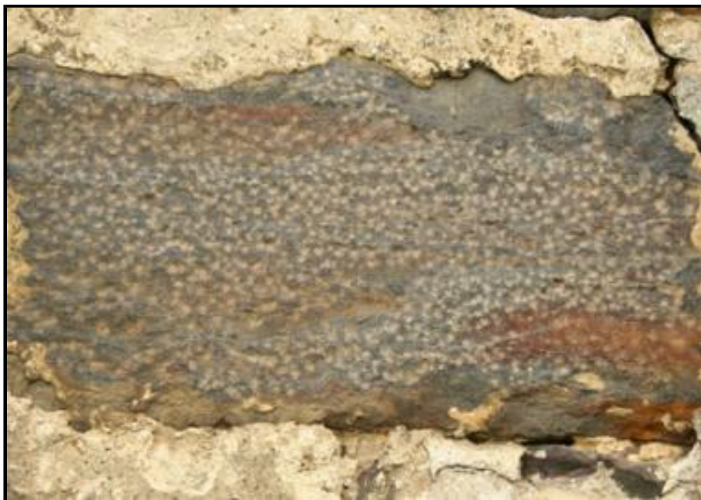
Fig. 1 - Traces de broche sur un bloc mis en œuvre sur l'église de Pourrain.