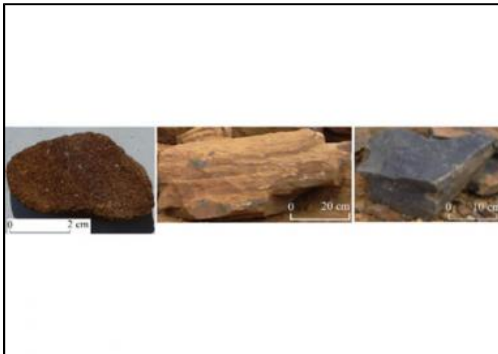
Fig. a - Grès maigre, grès franc et grès vif.