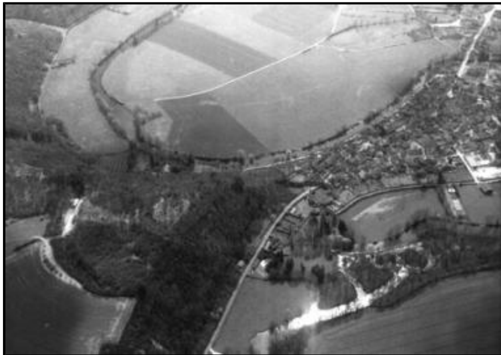
Fig. 1 - Noyers-sur-Serein (Yonne). Vue aérienne du château, hiver 2005.