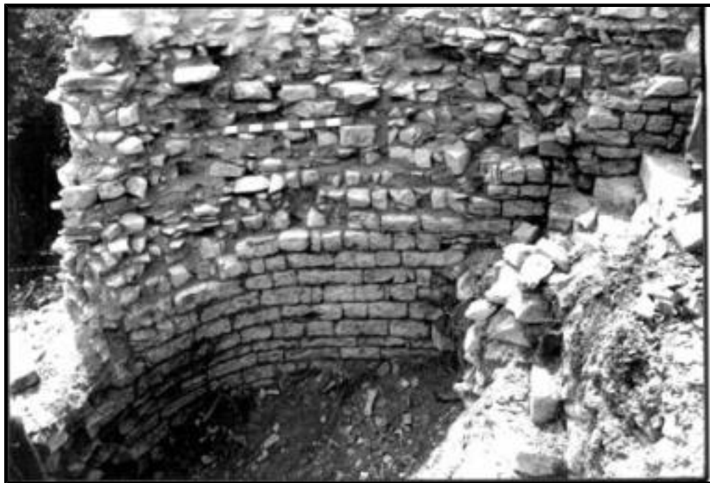
Fig. 3 - Noyers-sur-Serein (Yonne). Intérieur de la tour n° 1 en cours de dégagement, août 2000.

8 Notre documentation évoque surtout le château tel qu'il existait au XV e siècle. Il avait alors sans doute atteint sa forme la plus aboutie et n'évoluait plus beaucoup. Néanmoins, fruit d'une longue histoire, il a été constitué par étapes. Grâce à des indices ténus, nous avons proposé un essai de restitution de cette évolution, depuis sa genèse jusqu'à son état à la fin du XV e siècle, tel qu'il apparaît dans notre documentation.