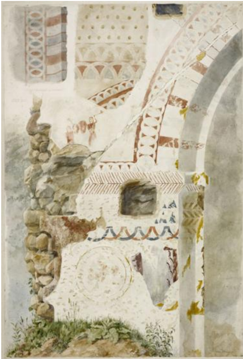
Fig. 2 - Relevé des peintures au nord de l'arc triomphal par Charles Chauvet, 1916 (ministère de la Culture et de la Communication, Service des archives photographiques de la Médiathèque de l'architecture et du patrimoine).