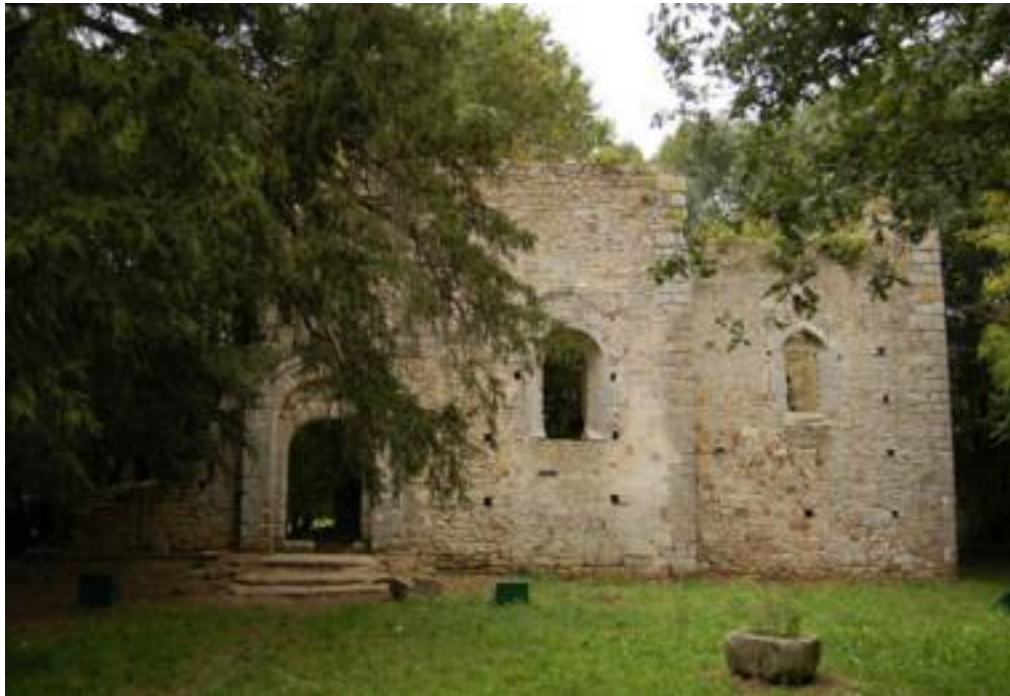
Fig. 1 - Vue de l'église depuis le sud.