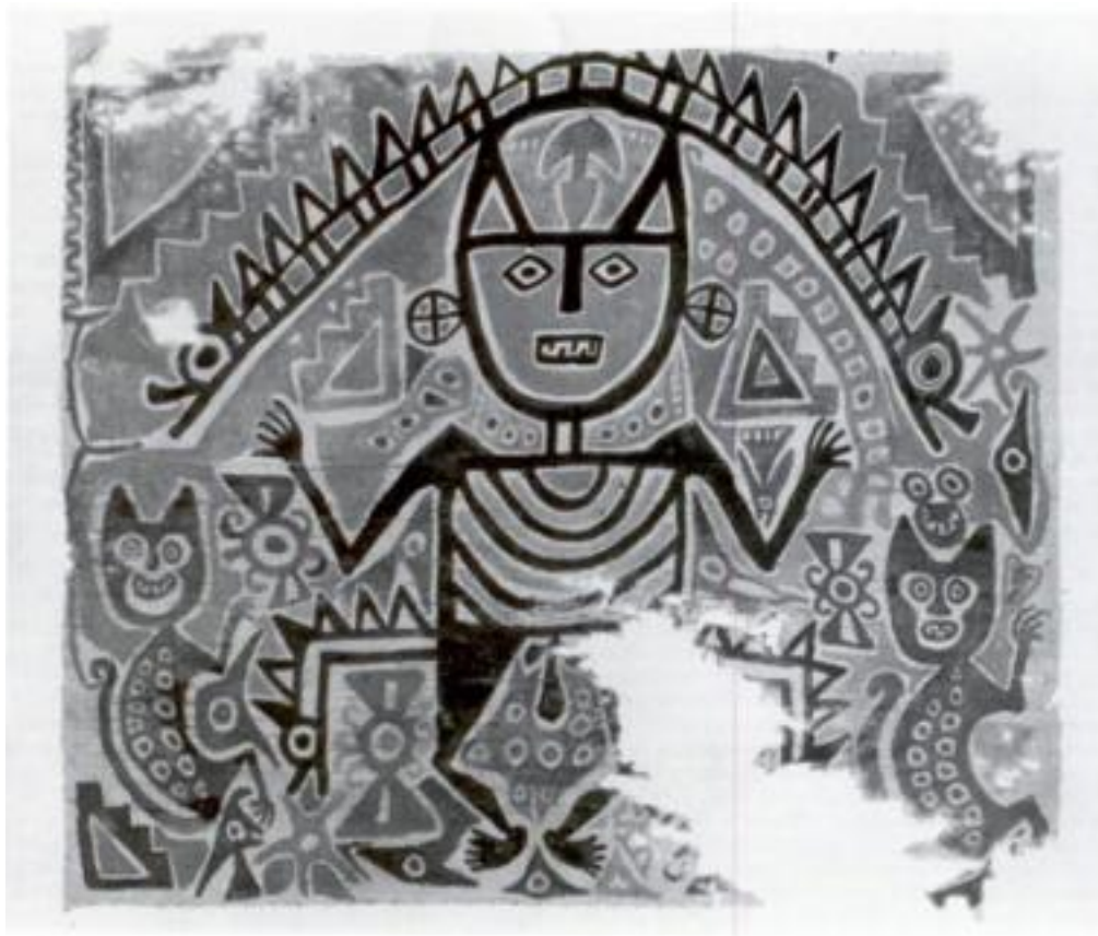
Fig. 2 - Textile Chimú, entre le VII e et le XIV e siècle (Pérou), 1300 apr. J.-C. ± 100.