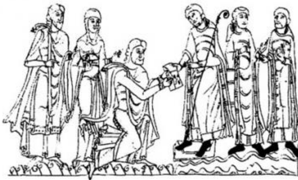
8 Fig. 3 - Cartulaire de Saint-Pierre de Vierzon (Dessin de Bruno Baudoin d'après Paris, BnF, ms. lat. 9865, fol. 5v).

9 Ainsi donc, par le moyen d'une approche croisée entre les textes et les images, la notion de « présentation » s'est-elle trouvée au centre des questions posées et des réponses apportées : autour du « construire » et du « connaître », dans l'interrogation sur la « présence de l'art » selon Paul Valéry ; dans l'analyse de la formation puis du développement des systèmes de connaissances au cœur des sociétés amérindiennes ; à travers la présence ou l'absence d'un discours figuratif sculpté sur les stalles de chœur, entre Moyen Âge et Renaissance ; dans l'étude des modes de présentation des actes et des acteurs, laïques à l'âge seigneurial, principalement à partir de l'exemple du cartulaire de Vierzon et de l'acte de donation. Ce sont autant de cas types, autant de remises en situations, qui permettent de mieux entrevoir les manifestations de l'écrit et celles du visuel, leur puissance de définition ostensive, le plus souvent à leurs intersections, dans des sociétés données, à des époques précises. Mises en registres, dispositifs graphiques, jeux de mots et d'images, la « présentation » s'affirme toujours comme l'élément déterminant de la raison graphique au cœur de ces sociétés 14 .