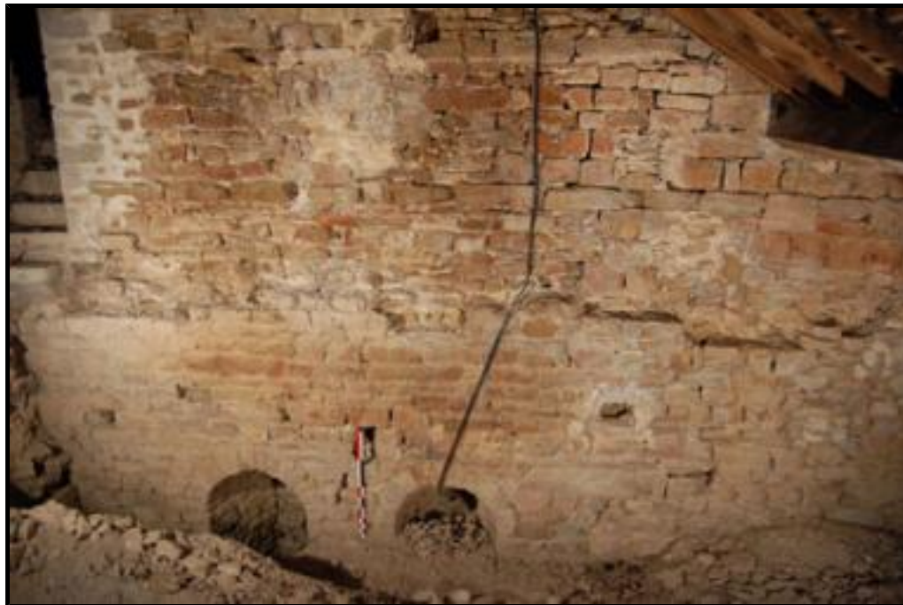
Fig. 2 - Vue du triplet de baies, parement extérieur du mur sud de la travée de chœur.

11 Plus à l'ouest du triplet, au-dessus de la voûte du bras sud du transept, l'analyse archéologique a encore révélé le piédroit d'une baie ébrasée, bouchée à une date inconnue, et qui ouvrait dans la « croisée » du transept 9 . Ses dimensions sont indéterminées et son emplacement semble bien fonctionner avec la voûte du bras sud du transept. Ces différents percements – triplet et baie à la « croisée » de transept – ont été également identifiés dans les combles du côté nord.