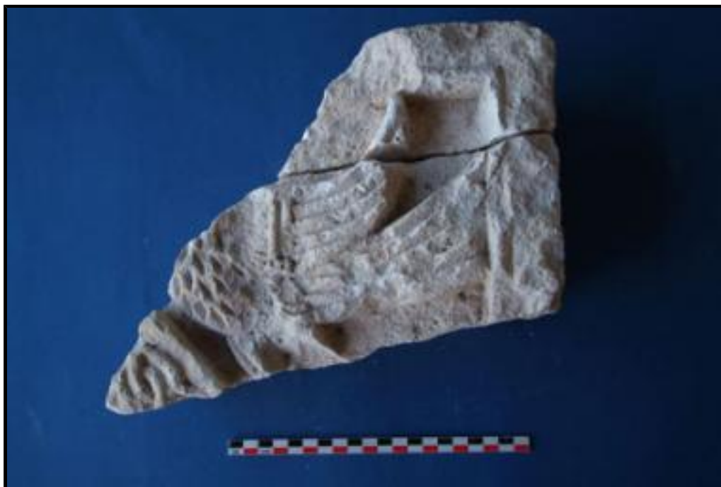
Fig. 2. Fragment d'une plaque décorée (chancel ?).