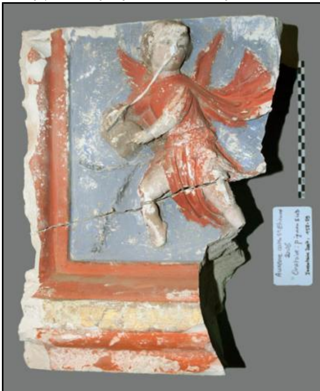
Fig. 1 - Claveau polychrome avec chérubin sculpté sur l'intrados.