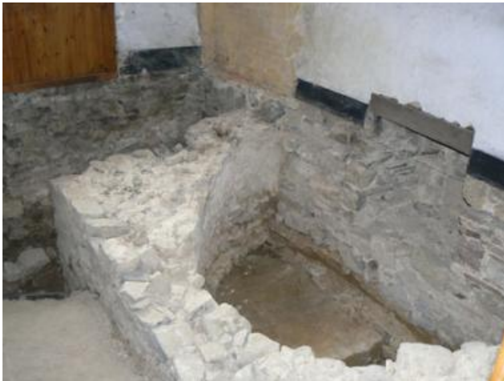
Fig. 1 - Saint-Gérard de Brogne. L'absidiole (Cliché CEM, G. Fèvre, 2007).