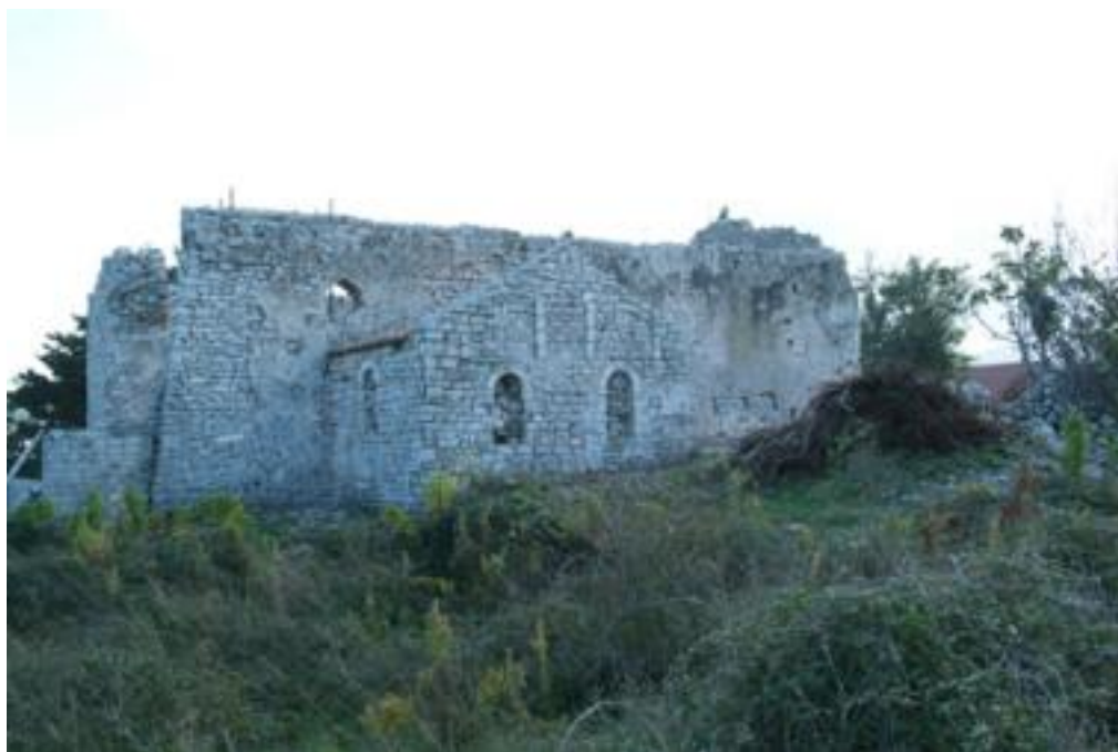
Fig. 1 - Vue générale de l'église Saint-Pierre depuis le sud (cliché L. Fiocchi).